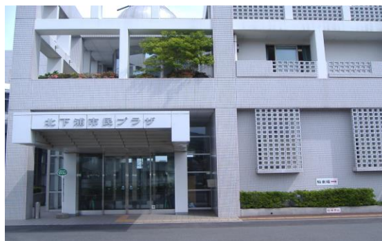
(施設外観・北下浦)