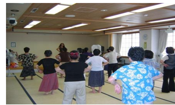
生きがい講座 (フラダンス・鴨居)