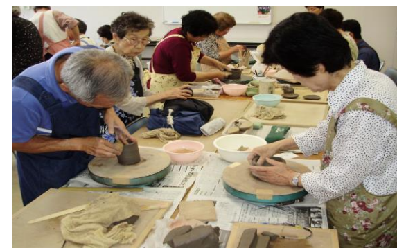
生きがい講座 (陶芸・本町)

原則として60歳以上の高齢者の方が健康で明るく楽しく、過ごしていただくための施設です。囲碁・マッサージ機・入浴・カラオケ・娯楽室等を無料で利用していただくことができます。また、各種の「生きがい講座」を実施したり、保健師による健康相談を開催したりしています。