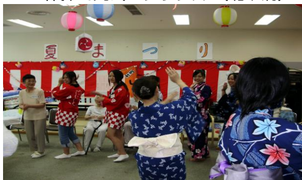
ボランティアさんとの夏祭り (本町)