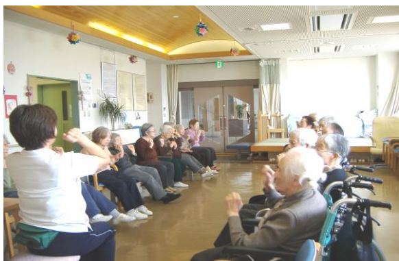
体操で元気ハツラツ!! (北下浦)

介護保険に基づくサービスで、日常生活で支援が必要な方や、寝たきり等で介護が必要な高齢者に対して、送迎・入浴・お食事・レクリエーション等、その方の求める各種サービスを提供する通所介護施設です。ご本人へのサポートと共に、ご家族の負担の軽減を図ります。